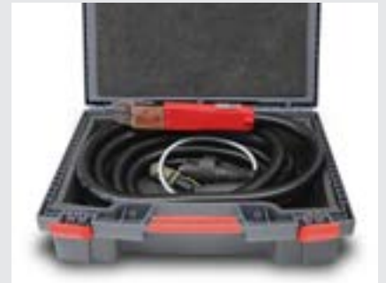
/ Köpük tabanlı sağlam taşıma bavulu