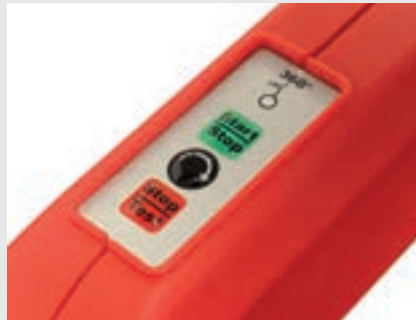
/ Tutamağa entegre kumanda tuşları