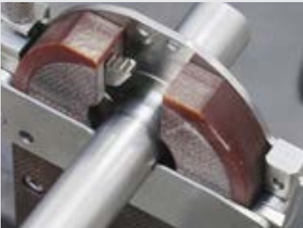
/ Kapalı koruyucu gaz haznesi sayesinde yüksek kaliteli kaynak sonuçları